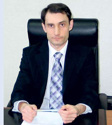
Директор Фонда медицинского страхования Андрей САУХИН:

- На 2015 год Фонд выделил Балаковской городской больнице дополнительно к обычному финансированию 38 миллионов рублей, из которых более 7 миллионов рублей предназначены на ремонт помещений и приобретение необходимого оборудования. Надеюсь, что эти деньги помогут лечиться людям более комфортно.