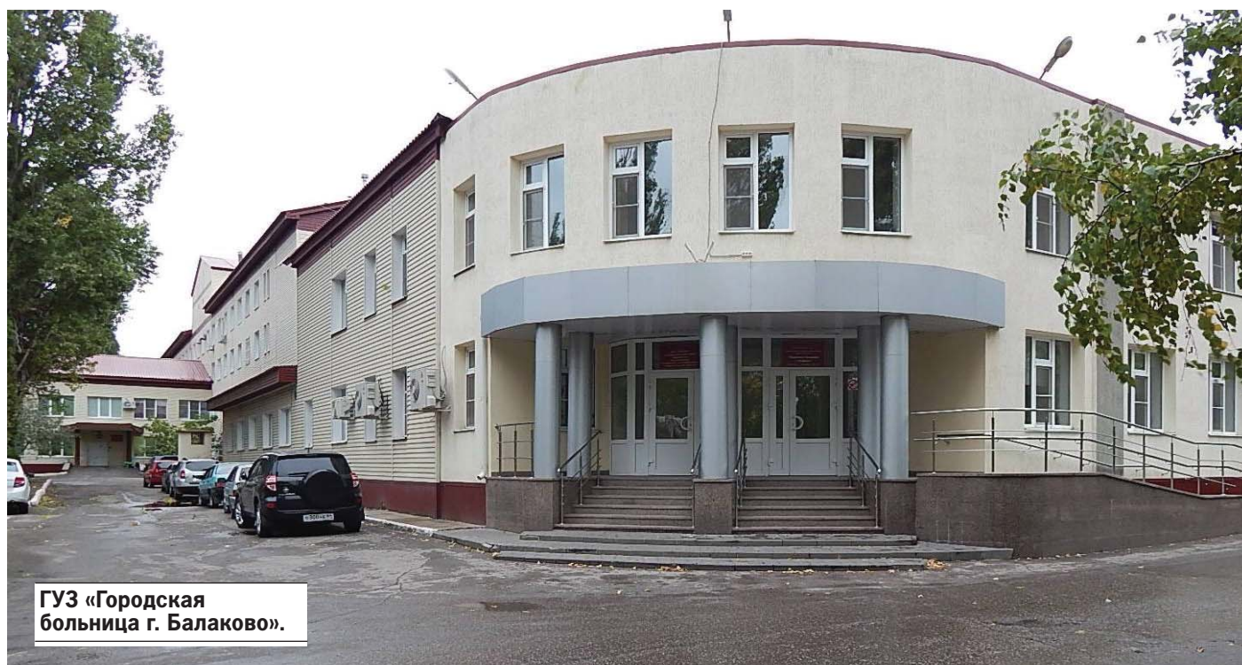
ГУЗ «Городская больница г. Балаково».

Городская больница г. Балаково - многопрофильный стационар с койочной мощностью 750 круглосуточных коек. Больница имеет статус межрайонного центра по оказанию специализированной медицинской помощи жителям близлежащих районов области. Ежегодно в больнице получают медицинскую помощь более 30 тысяч пациентов преимущественно по экстренной госпитализации. В больнице выполняются все виды хирургических операций при заболеваниях и травмах, в том числе в разделах сосудистой хирургии, онкологии, урологии, нейрохирургии, детской хирургии, оториноларингологии, гинекологии, стоматологии. В течение года проводится свыше 13 тысяч операций, более 30% из которых относятся к оперативным вмешательствам высокой категории сложности.