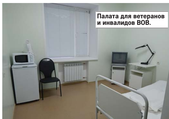
Палата для ветеранов и инвалидов ВОВ.