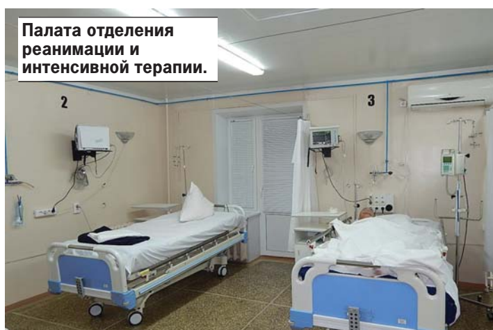
Палата отделения реанимации и интенсивной терапии.

- На выделенные дополнительные средства приобретено 126 единиц медицинского оборудования, в том числе предназначенного для проведения анестезиологических и реанимационных мероприятий, хирургических вмешательств, диагностических исследований, обеззараживания воздуха. Кроме того, проведен ремонт в отделении реанимации и интенсивной терапии, палатах для ветеранов войны, аптеке, кабинетах диагностических служб, кабинете для телемедицинских консультаций, детском хирургическом отделении. Проведены подготовительные работы к отопительному сезону, ремонт кровли, противопожарные мероприятия. В настоящее время благодаря вниманию к проблемам здравоохранения со стороны министерства здравоохранения Саратовской области, финансированию Территориального фонда ОМС созданы все условия для эффективного и качественного оказания медицинской помощи.