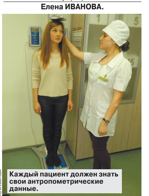
Каждый пациент должен знать свои антропометрические данные.

Если вы давно откладывали визит к врачу, сейчас самое время позаботиться о своём здоровье, ведь это не займёт много времени! Пройдите диспансеризацию или профилактический медицинский осмотр (если прохождение диспансеризации в этом календарном году не предусмотрено) в поликлинике по месту прикрепления.