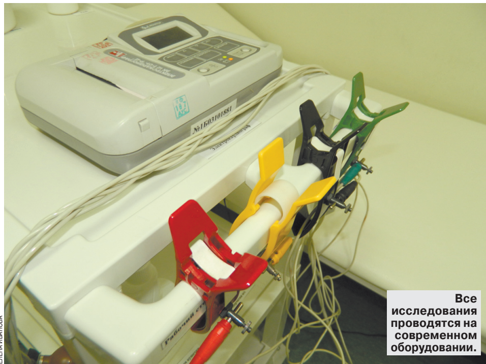
Все исследования проводятся на современном оборудовании.