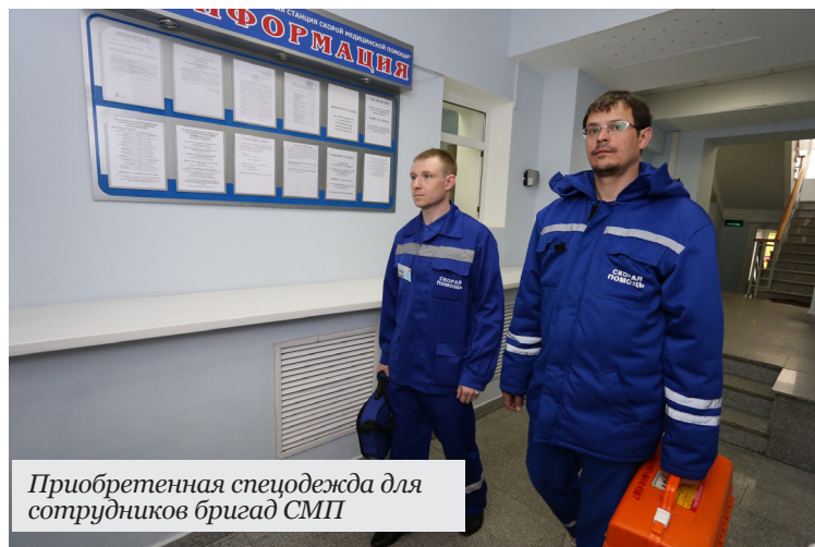
Приобретенная спецодежда для сотрудников бригад СМП