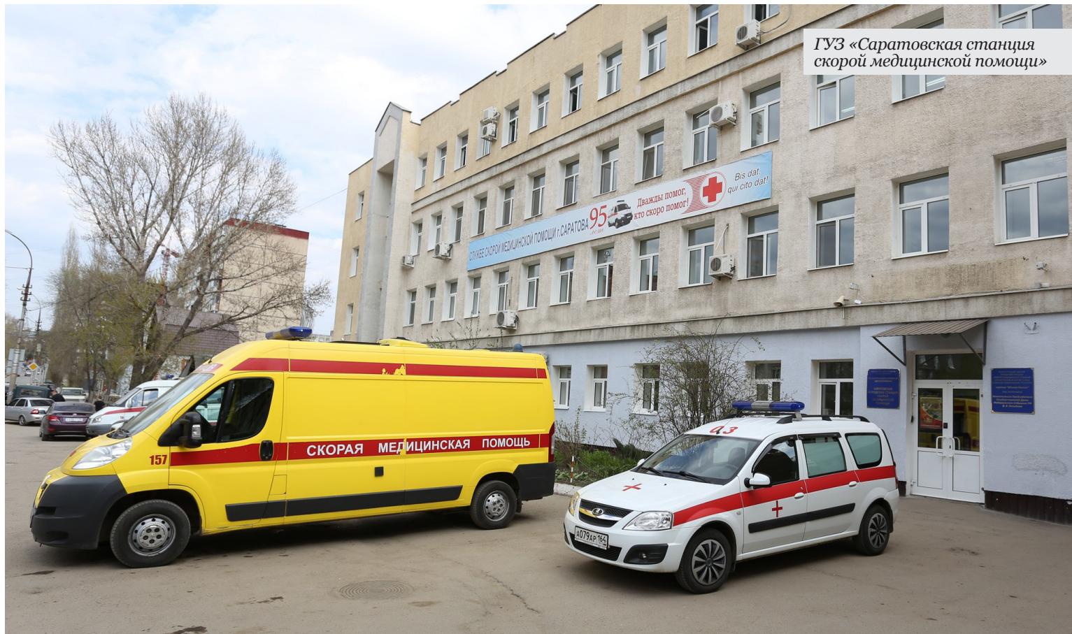
ГУЗ «Саратовская станция скорой медицинской помощи»