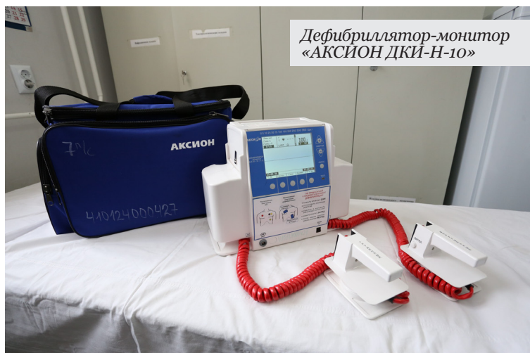
Дефибриллятор-монитор «АКСИОН ДКИ-Н-10»

но повышению уровня оперативности работы «скорой» – проведены меры по созданию и внедрению комплексной информационной системы автоматизации управления станциями скорой помощи, которые обошлись в 17 миллионов рублей. Данные меры позволили сократить время на прием вызова диспетчерами и прибытие специалистов на место вызова.