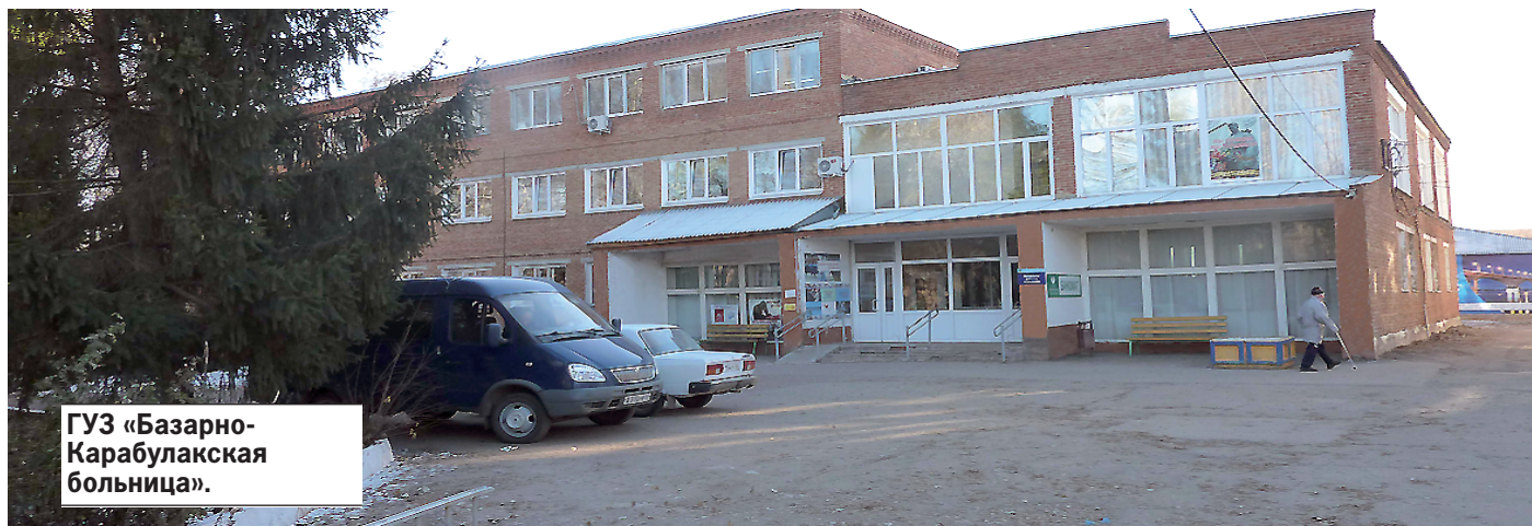
ГУЗ «Базарно-Карабулакская больница».

Территориальный фонд обязательного медицинского страхования Саратовской области выделил дополнительное финансирование на обновление Базарно-Карабулакской районной больницы. Всего за период 2015-2016 гг. на текущую деятельность данному учреждению было выделено 292 млн рублей, из которых 39 млн были дополнительными.