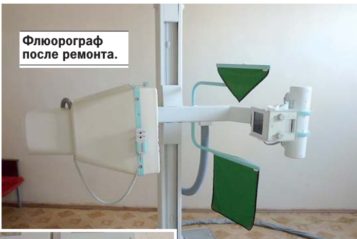
Флюорограф после ремонта.

Кроме того, в рамках подготовки к осенне-зимнему периоду были приобретены и установлены новые отопительные радиаторы и отопительные котлы. Серьезные затраты были связаны с необходимостью решения коммунальных вопросов, таких как бурение водяной скважины, прокладка трубопровода, ремонт водонапорной башни и т.д. Для обеспечения безопасности нахождения пациентов на территории больницы была приобретена и установлена система раннего обнаружения пожаров, передающая по выделенному радиоканалу