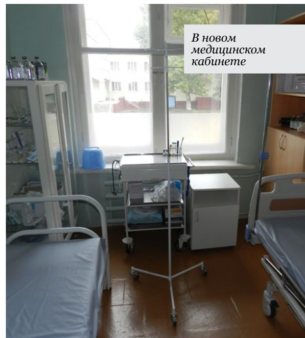
В новом медицинском кабинете