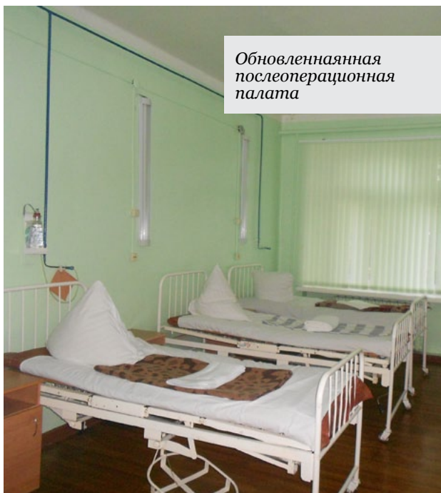
Обновленная послеоперационная палата