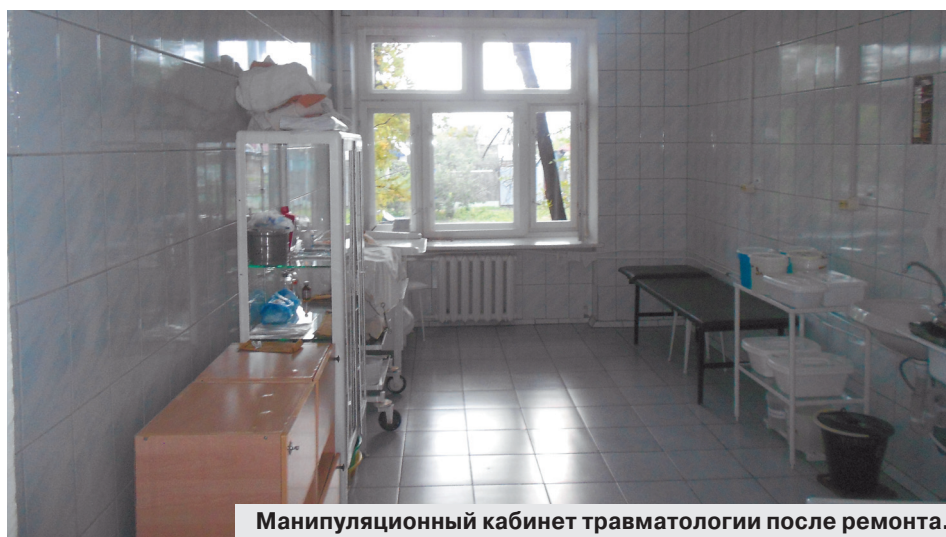
Манипуляционный кабинет травматологии после ремонта.