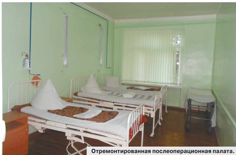
Отремонтированная послеоперационная палата.