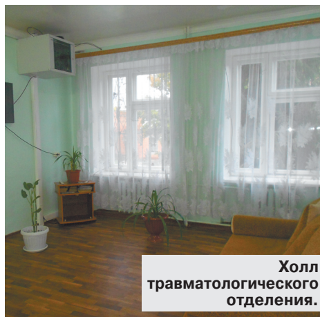
Холл травматологического отделения.