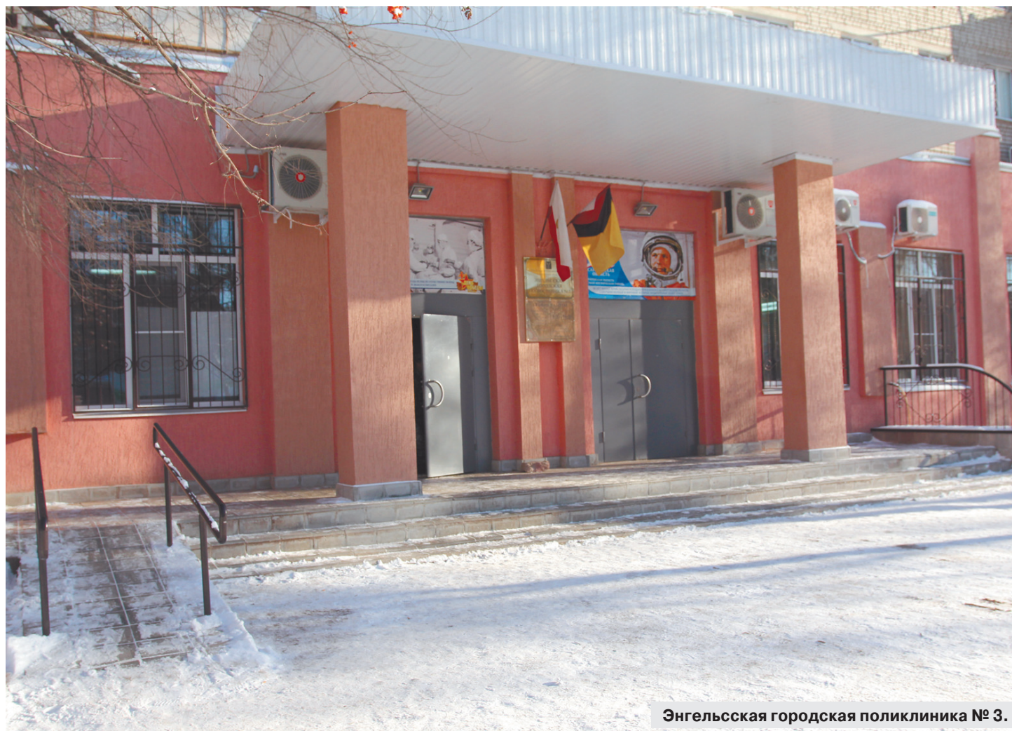
Энгельсская городская поликлиника № 3.

ТЕРРИТОРИАЛЬНЫЙ ФОНД ОБЯЗАТЕЛЬНОГО МЕДИЦИНСКОГО СТРАХОВАНИЯ САРАТОВСКОЙ ОБЛАСТИ ВЫДЕЛИЛ ДОПОЛНИТЕЛЬНОЕ ФИНАНСИРОВАНИЕ на развитие ГАУЗ «Энгельсская городская поликлиника № 3» в размере 69 млн руб.