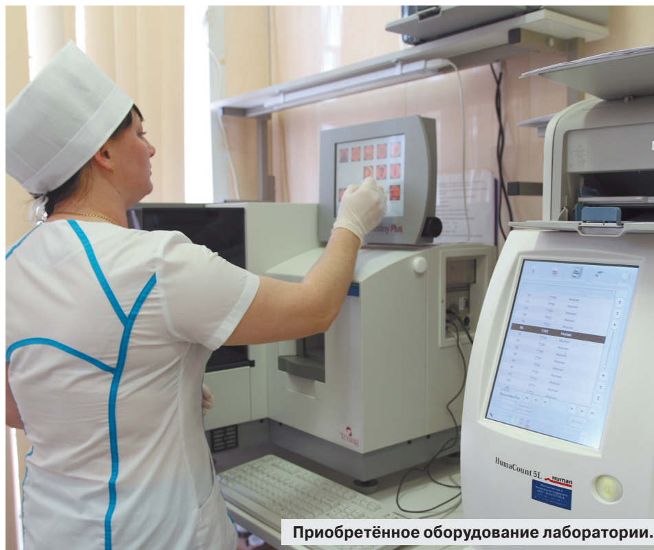
Приобретённое оборудование лаборатории.

Кроме того, за счёт средств областного бюджета было приобретено оборудование для Энгельсской городской поликлиники № 3 на сумму 25 млн руб. Теперь на вооружении поликлиники имеется новейшая аппаратура — иммуноферментный автоматический анализатор, обеспечивающий высокую производительность и точность проводимых лабораторных исследований, ультразвуковой диагностический прибор, гастрофиброскоп, применяемый для лабораторной диагностики заболеваний желудка и пищевода, биохимический анализатор HUMASTAR 600, позволяющий быстро и максимально качественно проводить исследования крови. Для того чтобы жители г. Энгельса могли получить медицинскую помощь на высоком уровне в своей поликлинике, было приобретено и другое дорогостоящее оборудование, в числе которого гематологический и флуориметрический анализаторы, офтальмологический бесконтактный тонометр, компьютерный электрокардиограф, автоматический анализатор глюкозы, реографический комплекс для автоматизированной оценки системного и регионарного кровотока и многое другое.