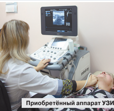
Приобретённый аппарат УЗИ.