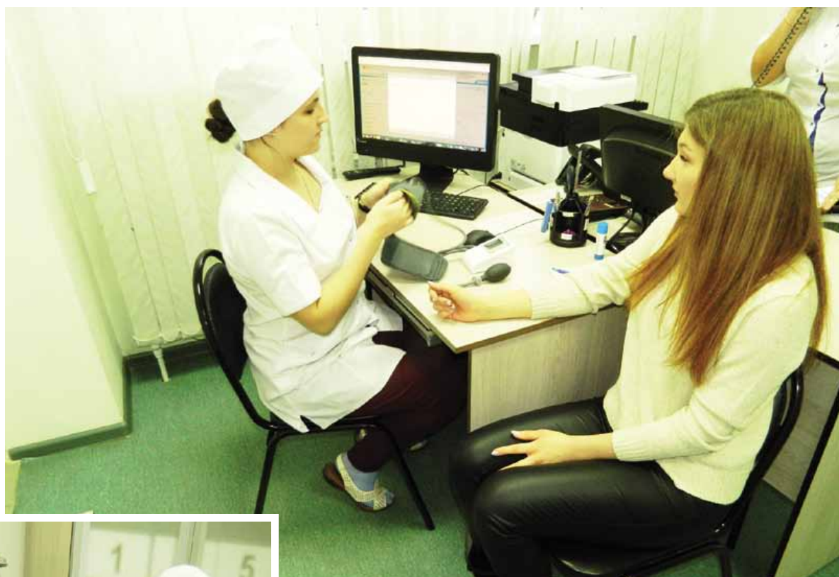
Диспансеризация позволяет выявить заболевания на ранней стадии развития.

Диспансеризация представляет собой комплекс мероприятий, в том числе профилакти-