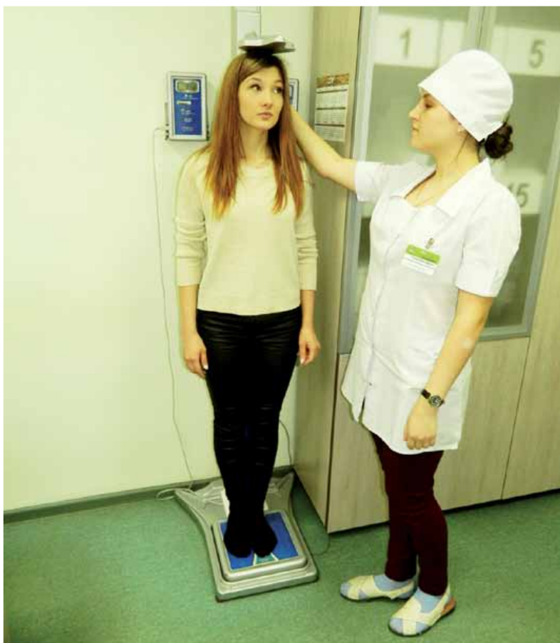
Профилактический медицинский осмотр можно пройти ежегодно.

ческий медицинский осмотр врачами-специалистами в целях оценки состояния здоровья (включая определение группы здоровья и группы диспансерного наблюдения), применение необходимых методов обследования, осуществляемых в отношении определенных групп взрослого населения, с целью раннего выявления хронических неинфекционных заболеваний (состояний), являющихся основной причиной инвалидности и преждевременной смертности населения Российской Федерации, таких как сахарный диабет, злокачественные новообразования, и основных факторов риска их развития (повышенный уровень артериального давления, повышенный уровень глюкозы в крови, пагубное потребление алкоголя, нерациональное питание, курение табака, низкая физическая активность, избыточная масса тела или ожирение), а так-