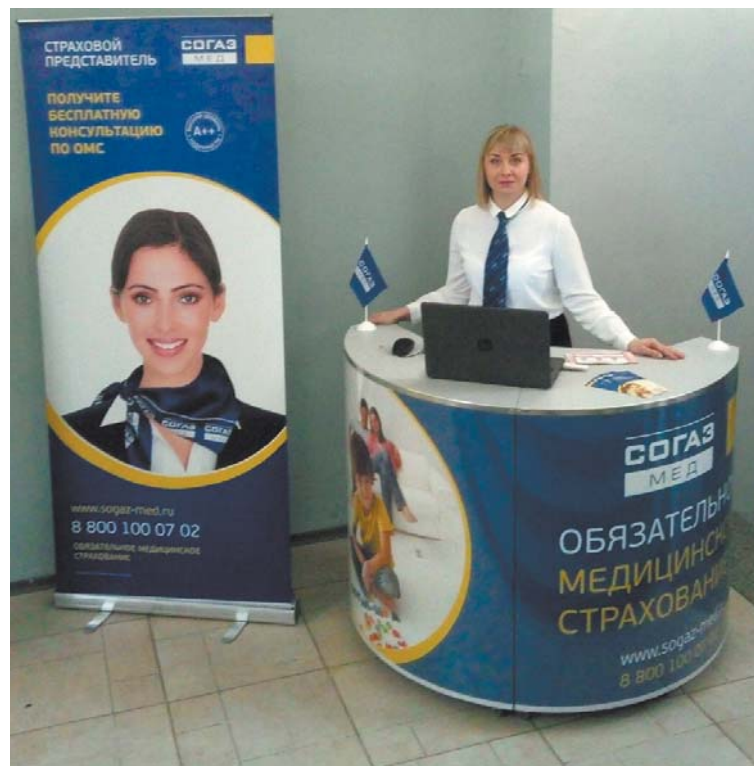
Контакт-центр в сфере обязательного медицинского страхования Саратовской области 8-800-775-10-35.

Каждый день мы сталкиваемся со множеством обращений застрахованных, – отмечает страховой представитель компании «СОГАЗ-Мед». – Застрахованная компания «СОГАЗ-Мед» обратилась за помощью с целью оказания содействия на получение направления на позитронно-эмиссионную и компьютерную томографию, так как обратившаяся является онкологической больной (перенесла мастэктомию по поводу рака молочной железы) и в настоящее время необходимо ис-