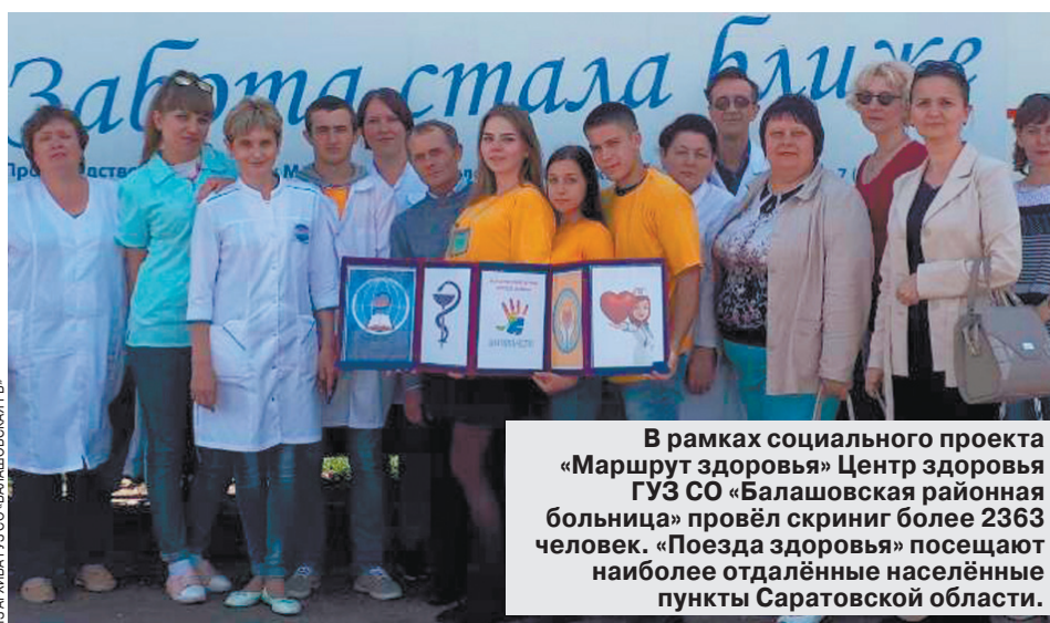
В рамках социального проекта «Маршрут здоровья» Центр здоровья ГУЗ СО «Балашовская районная больница» провёл скрининг более 2363 человек. «Поезда здоровья» посещают наиболее отдалённые населённые пункты Саратовской области.

В 2018 году специалисты мобильного центра здоровья побывали в вузах — СГУ, СГАУ, СГЮА, СГТУ им. Ю. А. Гагарина, в техникуме железнодорожного транспорта, в колледжах СГТУ им. Ю. А. Гагарина, радиоэлектроники им. П. Н. Яблочкова при СГУ им. Н. Г. Чернышевского, в средних обще-