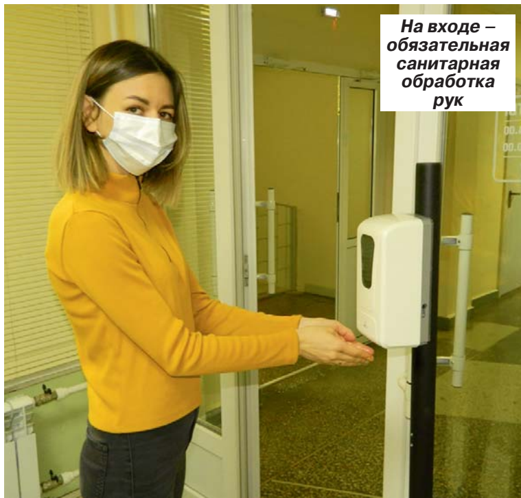
На входе – обязательная санитарная обработка рук

Ежегодно диспансеризация и профосмотры помогают выявить на ранних стадиях различные проблемы со здоровьем ни о чем не подозревающих пациентов и, следовательно, вовремя назначить лечение и предотвратить возможные риски и серьезные последствия. Однако в текущем году распространение новой коронавирусной инфекции внесло коррективы и в данное направление медицины – в марте пришлось приостановить и диспансеризацию, и профосмотры. Вернулась ситуация в привычное русло только с переходом на второй этап снятия ограничений – жители Саратовской области вновь стали получать сообщения от своих страховых организаций с приглашением прийти и проверить собственное здоровье.