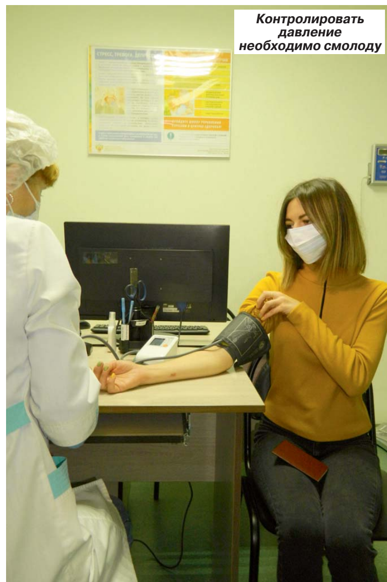
Контролировать давление необходимо смолоду

Медики настойчиво советуют не пренебрегать диспансеризацией, поскольку она позволяет вовремя выявить наличие хронических заболеваний.