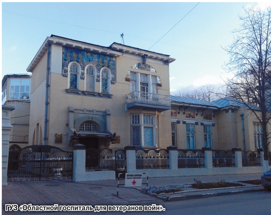
ГУЗ «Областной госпиталь для ветеранов войн».

— За последний год госпиталь заметно преобразился. Особенно понравился обновлённый корпус на 6-й Дачной, где сделали хороший ремонт и стало гораздо приятнее находиться. А комфортные условия пребывания сказываются ведь и на настроении, а от хорошего настроения и здоровье зависит. Замечательно, что приобрели новую аппаратуру, это повысило надежду на сохранение и восстановление здоровья ветеранов.