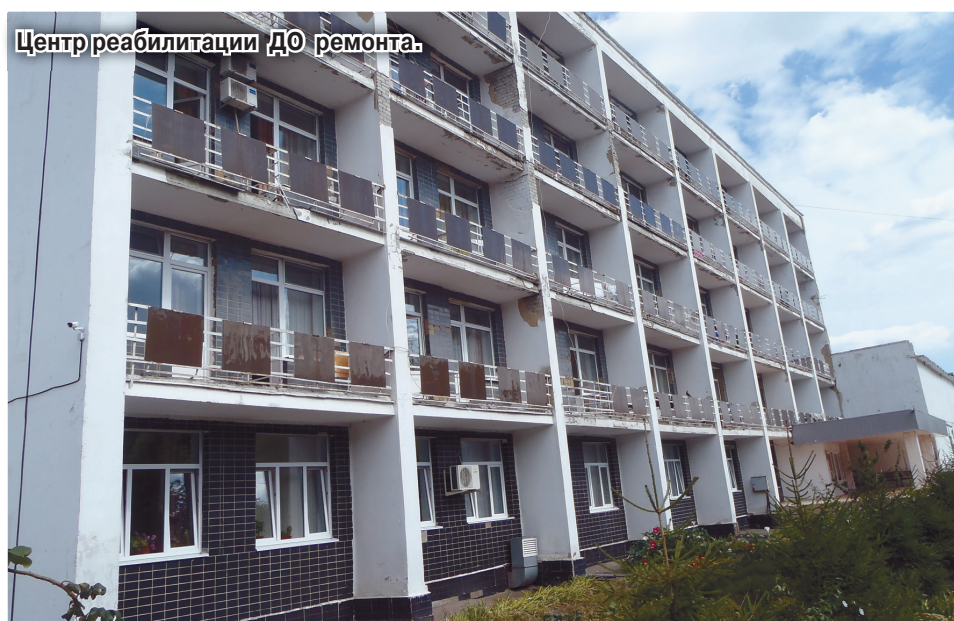
Центр реабилитации ДО ремонта.