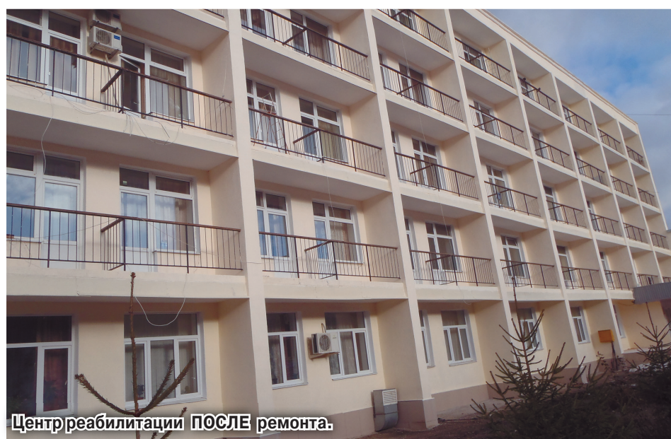
Центр реабилитации ПОСЛЕ ремонта.