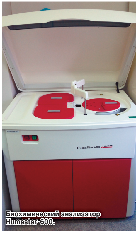
Биохимический анализатор Humastar-600.