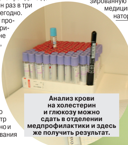
Анализ крови на холестерин и глюкозу можно сдать в отделении медпрофилактики и здесь же получить результат.

Если в текущем году проведение диспансеризации гражданину не положено — не беда, можно пройти профилактический медицинский осмотр. Преимущество профилактического медосмотра в том, что его можно проходить в любом возрасте по желанию пациента. Медосмотр проводится бесплатно и ежегодно. Исследования