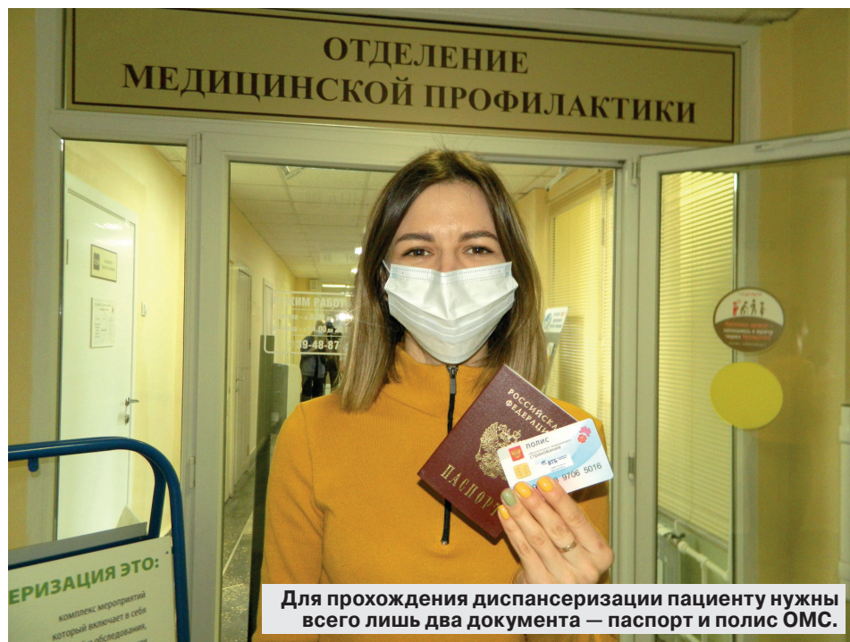
Для прохождения диспансеризации пациенту нужны всего лишь два документа — паспорт и полис ОМС.

Врачи рассказали, почему важно не откладывать диспансеризацию в период пандемии коронавируса